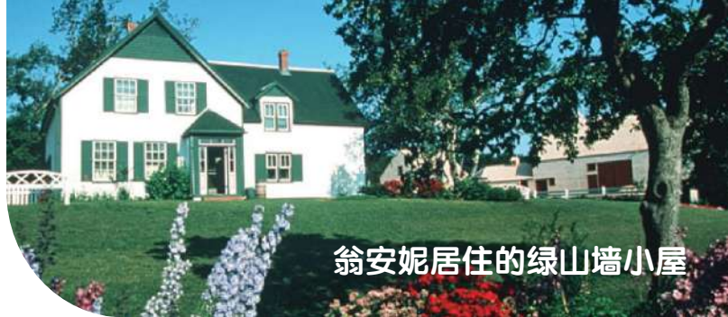
翁安妮居住的绿山墙小屋