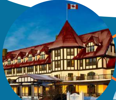
St Andrews 圣安祖海滨小镇