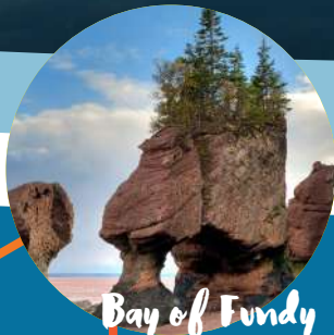
Bay of Fundy 芬迪湾