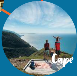
Cape Breton 布雷顿角